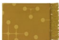
Eames Wool Blanket mustard