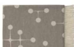
Eames Wool Blanket taupe