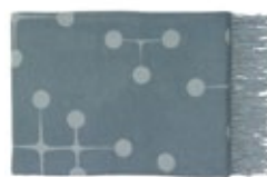
Eames Wool Blanket light blue