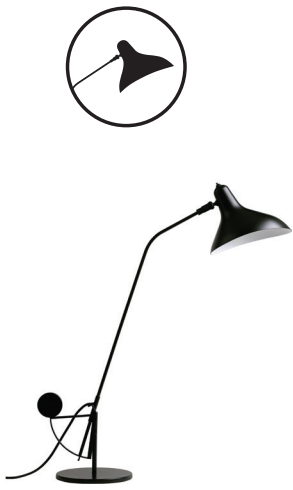
Table lamp | Lampe de table