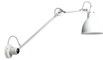
N°304 L 40 WH-WH

Black satin steel | Colored, chromed or coppered shade Acier noir satin | Réflecteur couleur, chromé ou cuivré