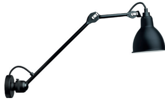
N°304 L 40 BL-SAT

Black satin steel | Colored, chromed or coppered shade Acier noir satin | Réflecteur couleur, chromé ou cuivré